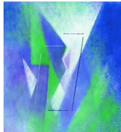
Rudolf Steiner De filosofie van de vrijheid

In het begin profileerde Rudolf Steiner zich als filosoof. Dit culmineerde in het werk: De filosofie van de vrijheid uit 1893. Hierin breekt hij een lans voor de mens als geestelijk wezen, en wijst hij op de betekenis van het denken. Door ons denken zijn we in staat om orde te scheppen in onze verbrokkelde waarnemingen, waardoor een waarachtig en samenhangend wereldbeeld kan ontstaan. Het denken dwingt niet, maar levert juist een betrouwbare grondslag om ons als vrij wezen te manifesteren. In de diepere gronden van het denken weven ook gevoelens en wilsintenties. Verder verdedigt Steiner een individualistische ethiek. Ieder mens kan met zijn talenten en strevingen op grond van morele intuïties zich harmonisch invoegen in een wereld van “vrije geesten”.